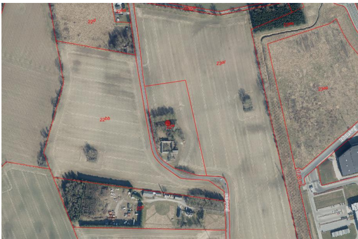
Kort som viser matr.nr. 22a, Ølsemagle By, Ølsemagle